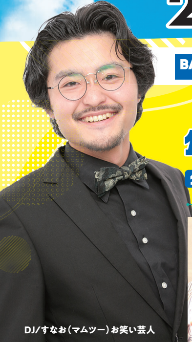
DJ/すなお(ママツー)お笑い芸人